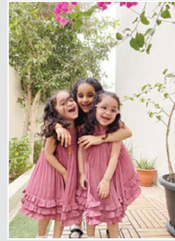
○ أغلى ما لديها