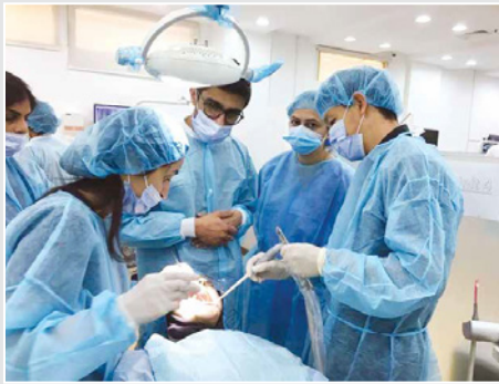
○ طريق النجاح صعب